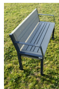
Réf. : BCG