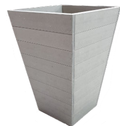
Réf. : JOC-62