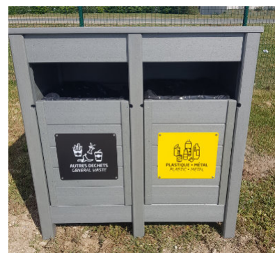
Réf. : PCT-2