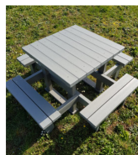
Réf. : TPN-CAR-90