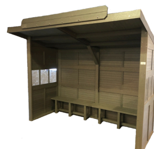
Réf. : ABU-300 / ABU-200