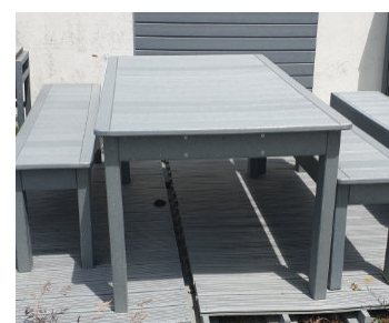
Réf. : EVO-175