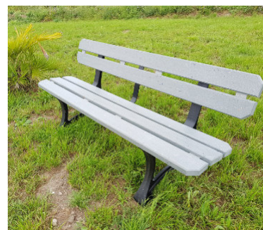
Réf. : BCU